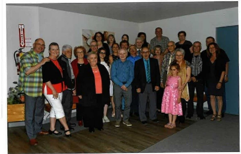
Parents et amis