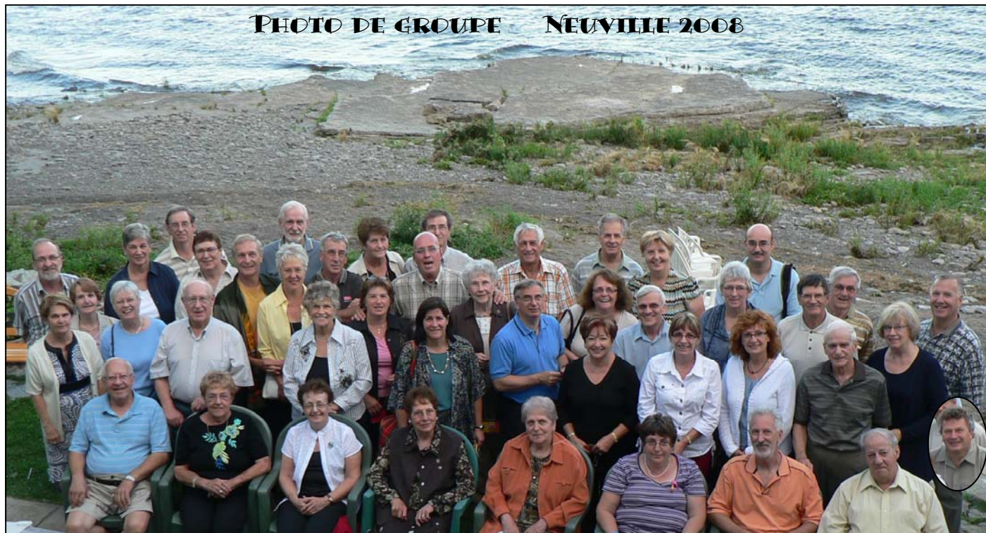
PHOTO DE GROUPE NEUVILLE 2008