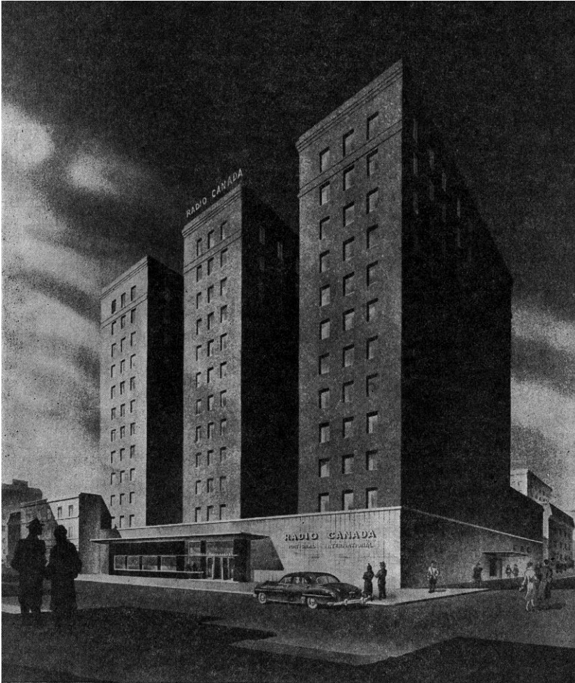
Croquis de l'édifice Ford, siège social de la Société Radio-Canada, à Montréal.

Source. The BBC Quarterly , Vol. 7, n° 2, été 1952, p. 103.