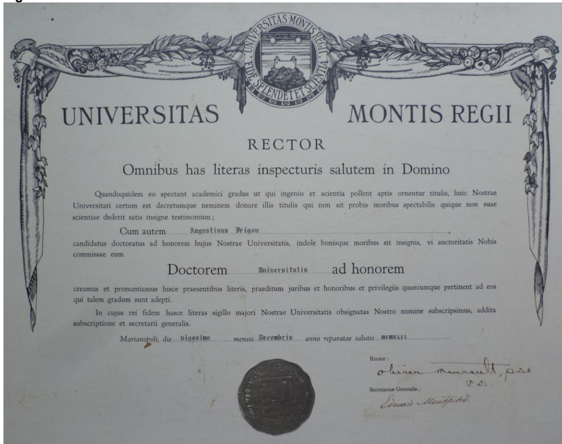
Figure A4 – 9.4