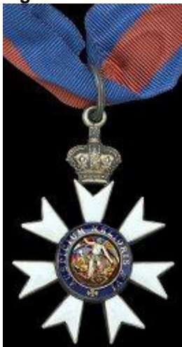
Figure A4 – 9.5

Médaille compagnon de l'ordre de Saint-Michel et de Saint-Georges (CMG).