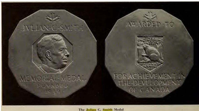
Médaille Julian Smith

Source : Engineering Journal , Vol. 23, n° 10, octobre 1940, p. 438.