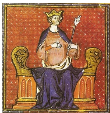
Hugues Capet, roi de France.

Six siècles plus tard, durant les années 1920, on décrit l'antique cité gallo-romaine avec le même enthousiasme : « Et depuis le 14 e siècle, Senlis n'a pas changé. Ce sont toujours les mêmes futaies qui l'enserrent de toutes parts, les mêmes vergers fleuris que traverse la Nonette, les mêmes rues tortueuses et désertes bordées de vieux logis de pierre; la vigne a disparu, les grandes caves n'abritent plus ces vins que le vieux chroniqueur déclarait exquis » 3 . Au 21 e siècle, Senlis est encore une ville champêtre puisqu'elle est au cœur du parc naturel régional Oise-Pays de France.