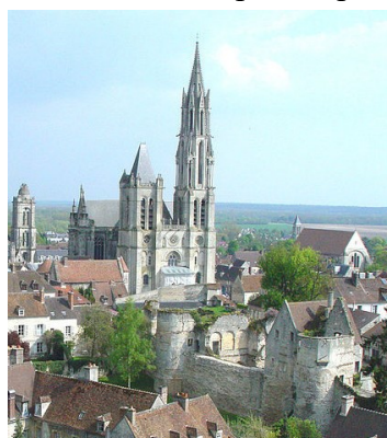
Au premier plan, les vestiges du Château.

Cette terre royale sera convoitée et devra se défendre à plusieurs reprises contre des attaques de prétendants au trône ou d'envahisseurs anglais. Aussi, la ville, comme toutes celles de cette époque, était fortifiée. À l'intérieur de la forteresse, construit sur l'emplacement d'un ancien palais romain, se trouve le Château royal. Il sera complètement rebâti sous Charles le Gros, vers 1130. À la Révolution française, il tombe en ruines. Les bâtiments subsistants sont pour la plupart démolis en 1812 et 1861. De nos jours, il ne reste que les ruines illustrées par les photos ci-jointes.