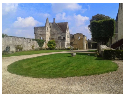
Le Château vu de l'autre côté.